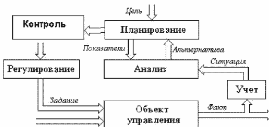
Рисунок 3 – Технология процесса управления

Нумерация листов курсовой работы должна быть сквозной для текста и приложений, начиная с титульного листа. Проставляется нумерация с третьего листа (титульный лист и задание не нумеруются). Номер листа проставляется в справа внизу шрифтом TimesNewRoman.